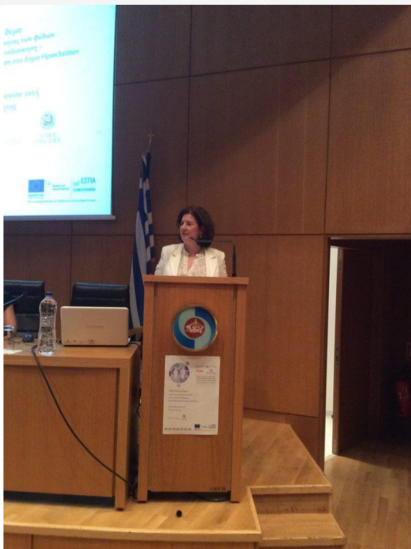
Ομιλία Γενικής Γραμματέως Ισότητας των Φύλων στην ημερίδα που πραγματοποιήθηκε στο Ηράκλειο στις 15/6/2015.

Η Τοπική Αυτοδιοίκηση ως θεμελιώδες κύτταρο κοινωνικής συνοχής αποτελεί βασικό φορέα άσκησης πολιτικής και παροχής υπηρεσιών στο πλαίσιο της