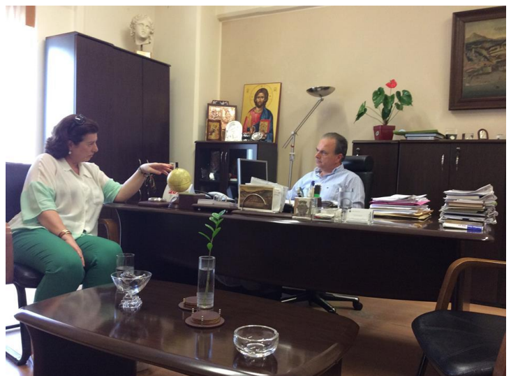
Δεύτερη Ημέρα: Συνάντηση Γενικής Γραμματέως Ισότητας των Φύλων με το Δήμαρχο Ρεθύμνης, κ. Γιώργο Μαρινάκη.