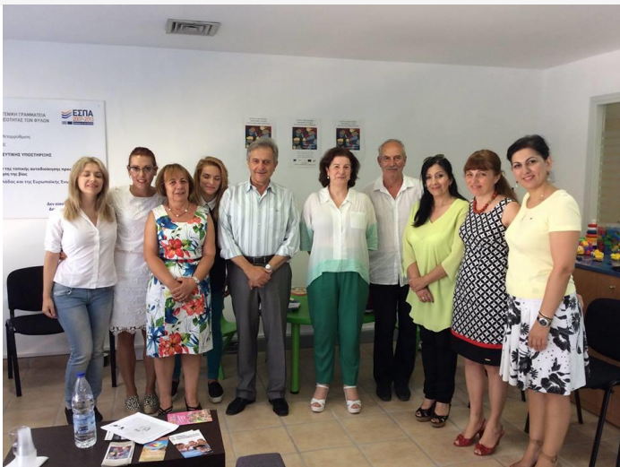
Συνάντηση Γενικής Γραμματέας Ισότητας των Φύλων με Αντιδημάρχους και στελέχη του Δήμου Ρεθύμνου.

E-mail: ggif@isotita.gr , gramggif@isotita.gr